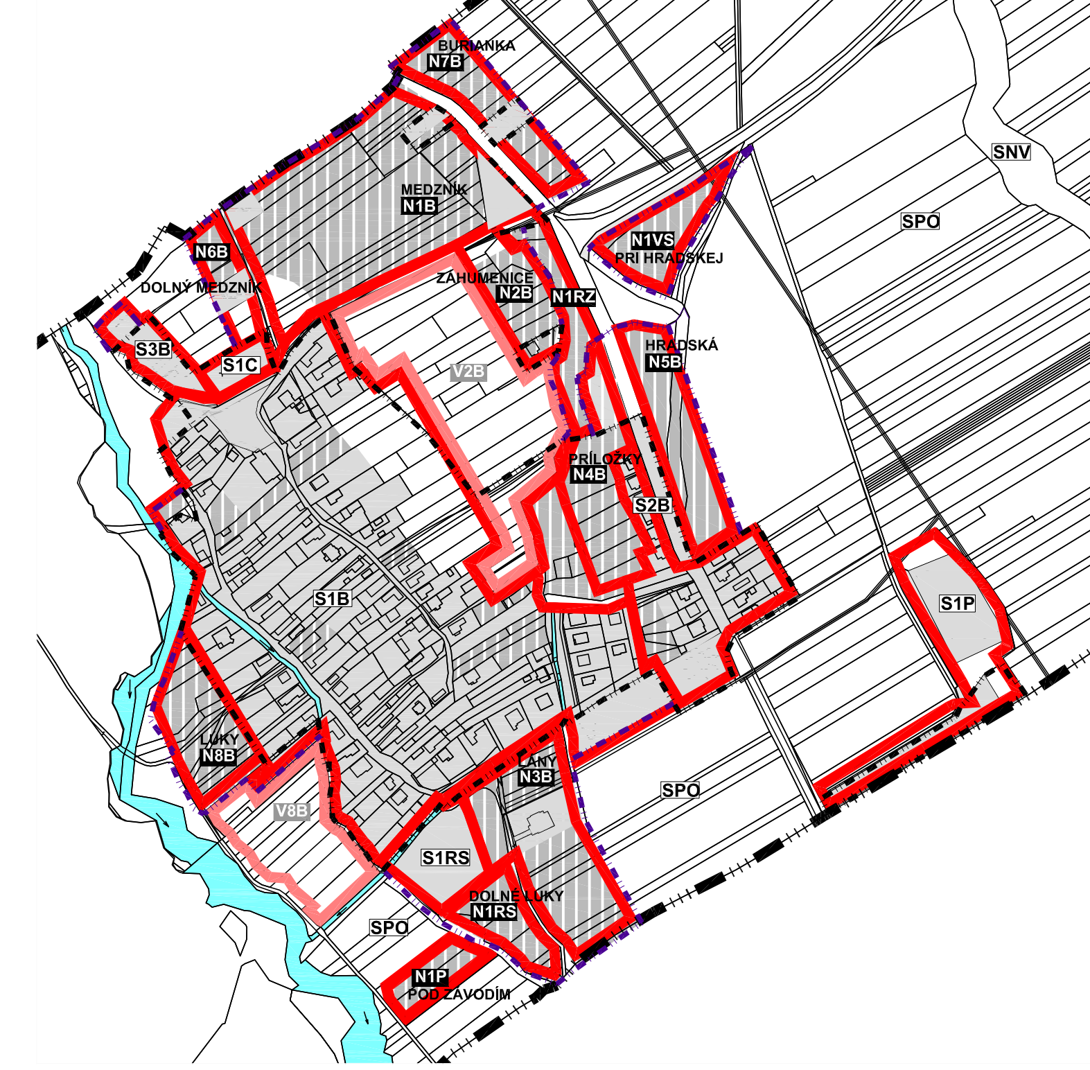
SCHEMA URBANISTICKÝCH BLOKOV